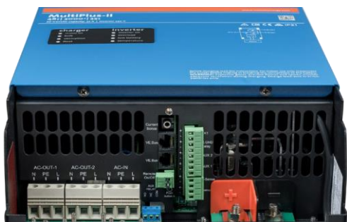
Сторона підключень MultiPlus-II 3к

Вимірює напругу та температуру батареї і забезпечує моніторинг та керування зі смартфона або іншого пристрою з Bluetooth.